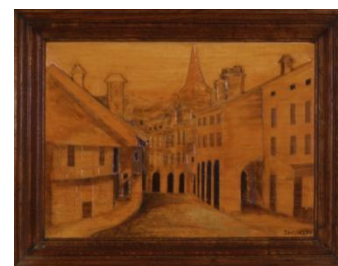
Tableau sculpté 18 mai 1852. En hommage à la ville de Louhans et à son maire le sénateur Henri Varlot. Sacliashi

Ces photographies sont disponibles par mail sur simple demande Contact presse : Dorothée Royot promotion@ecomusee-de-la-bresse.com ou 03.85.76.27.16