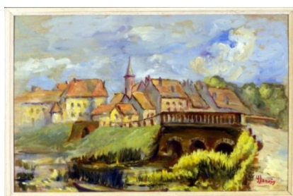
Vue de Louhans depuis le chemin de halage Yvonne Jannin